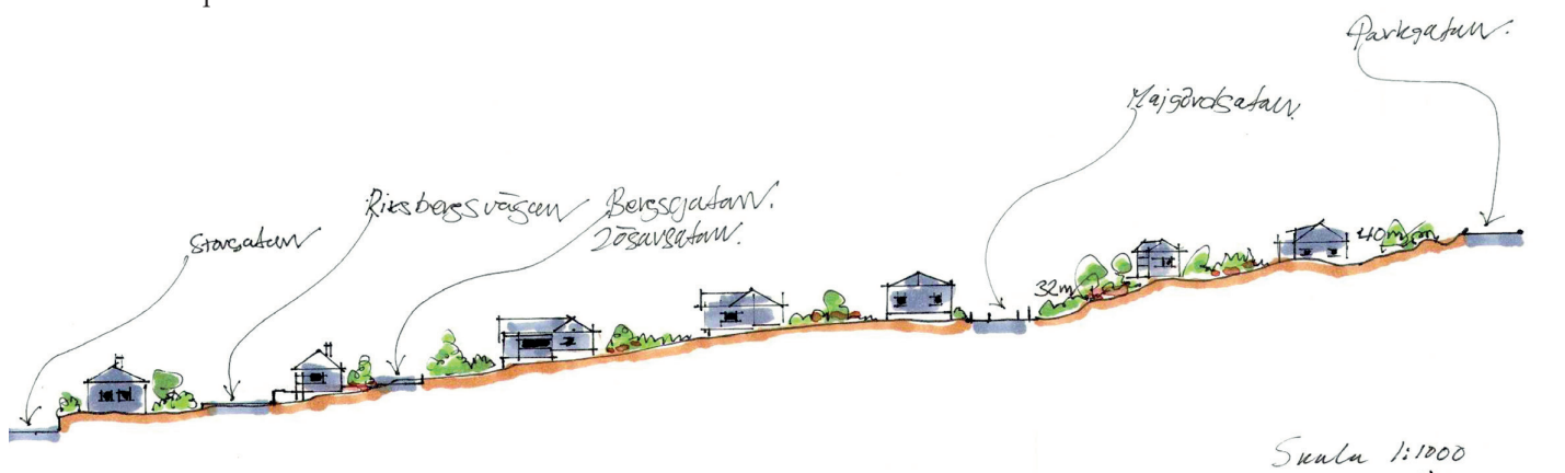
Illustration: Hans-Göran Utstrand

Ulricehamn växer snabbt – inte minst inom centralorten. Det ställer krav på ökad framförhållning i köp av mark och planering av nya bostadsområden. Liberalerna vill stärka resurserna på detta område.