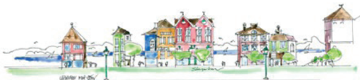
Illustration: Hans-Göran Utstrand

Liberalerna har varit pådrivande för att ta fram de generella riktlinjer som nu gäller för hela Ulricehamns stad och som ska vara vägledande i all typ av stadsutveckling. Nu är det viktigt att följa upp så det blir så bra som vi tänkt!